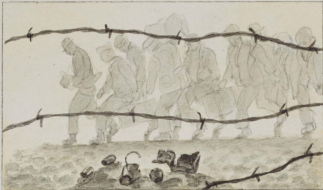
Les indésirables CAMP DE GURS 1940

KURT LÖW (UND KARL BODEK). Les indésirables (Die Unerwünschten), Camp de Gurs, 1940. Kortesia / Cortesía: Elsbeth Kasser Stiftung, Archive für Zeitgeschichte (AfZ) Zürich.